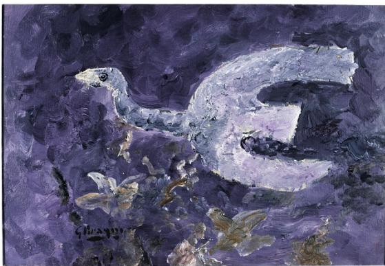
Georges BRAQUE (1882 – 1963) Oiseau en vol , 1962 Huile sur toile, 38,1 x 55 cm